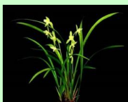
兰花 Chinese orchid