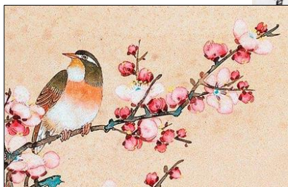
工笔梅花图局部 (邓白, 1906—2003)