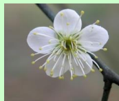
梅花 plum blossom