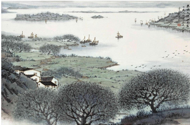
春风又绿江南岸（宋文治画）

京口瓜洲一水间， 钟山只隔数重山。 春风又到江南岸， 明月何时照我还(back, return)？