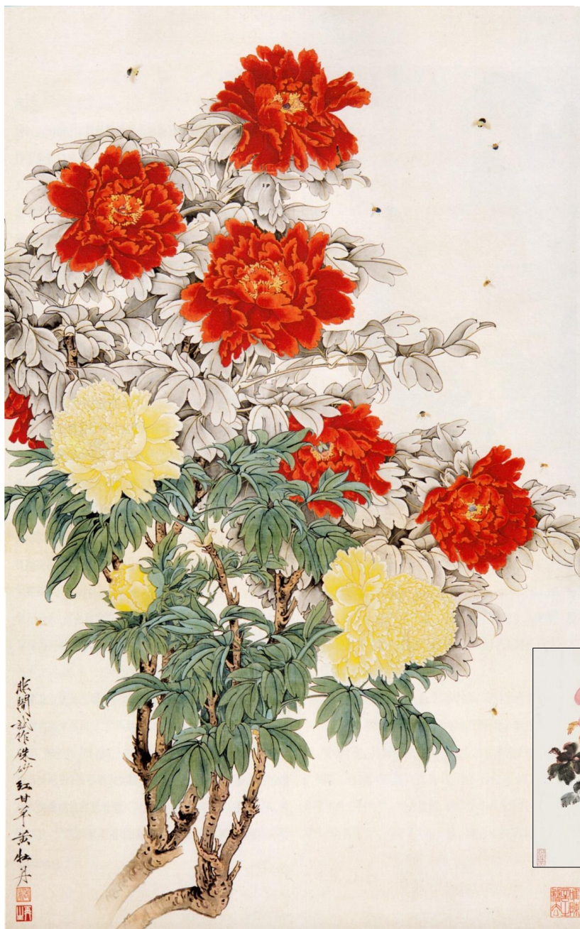
牡丹（于非闇(àn), 1889—1959, 128.5cm79cm 中国美术馆藏）

Comment [L9]: 除整体的感受外，尤其可引导学生欣赏画的细部，花瓣、花叶，甚至叶筋等（请注意指出“叶筋”，后面阅读材料《文房四宝》会提到。