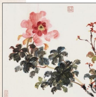
写意牡丹图局部 (张大千, 1899—1983)

当然，工笔画也不是一味追求逼真，比如画家巧妙地 把红牡丹的叶子画成淡灰色，既使得两棵牡丹有所区分，也使得画面更加漂亮。