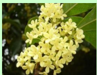
桂花 sweet osmanthus